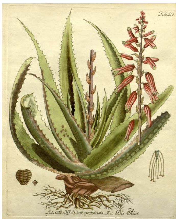
Babosa: Aloe vera (L).