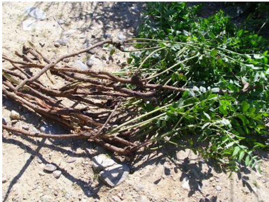
Alcaçuz (Glycyrrhiza glabra) Google imagens