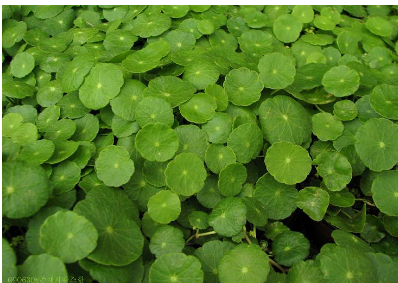
Acariçoba: ( Hydrocotyle umbellata ) Google imagens