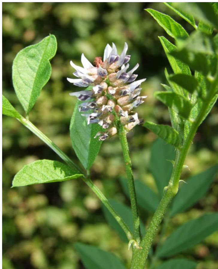
Alcaçuz (Glycyrrhiza glabra) Google imagens