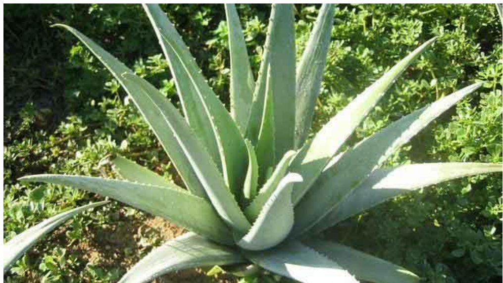
Babosa: Aloe vera (L)