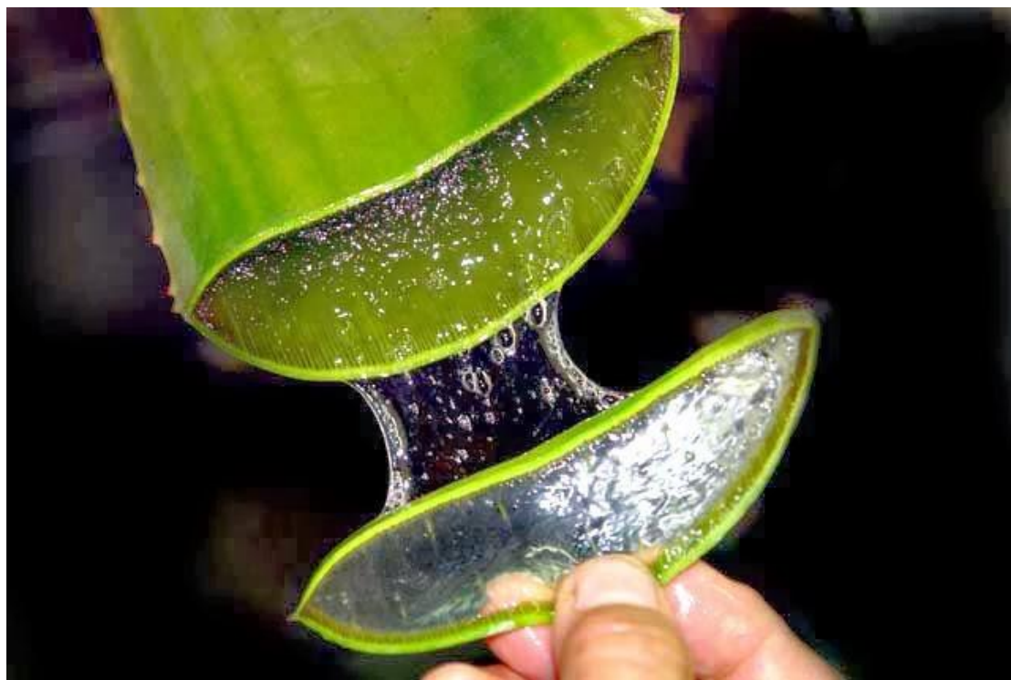
Babosa: Aloe vera (L).