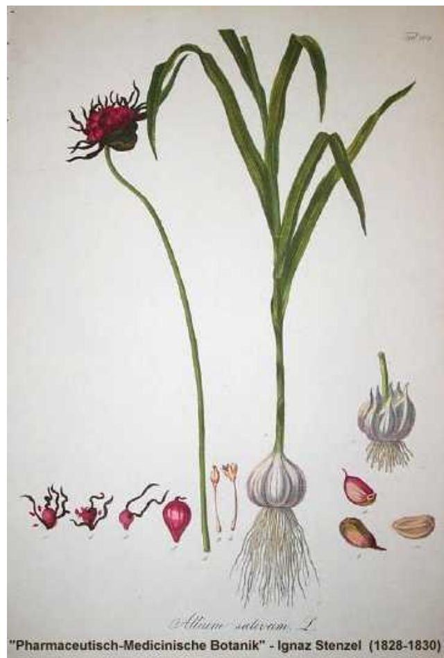
Alho: Allium sativum (L).