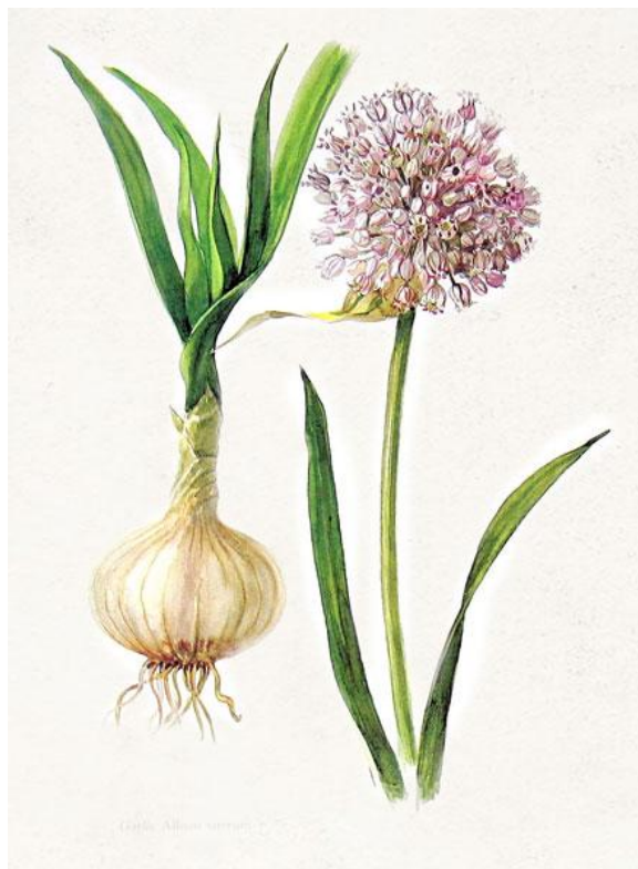
Alho: Allium sativum (L).