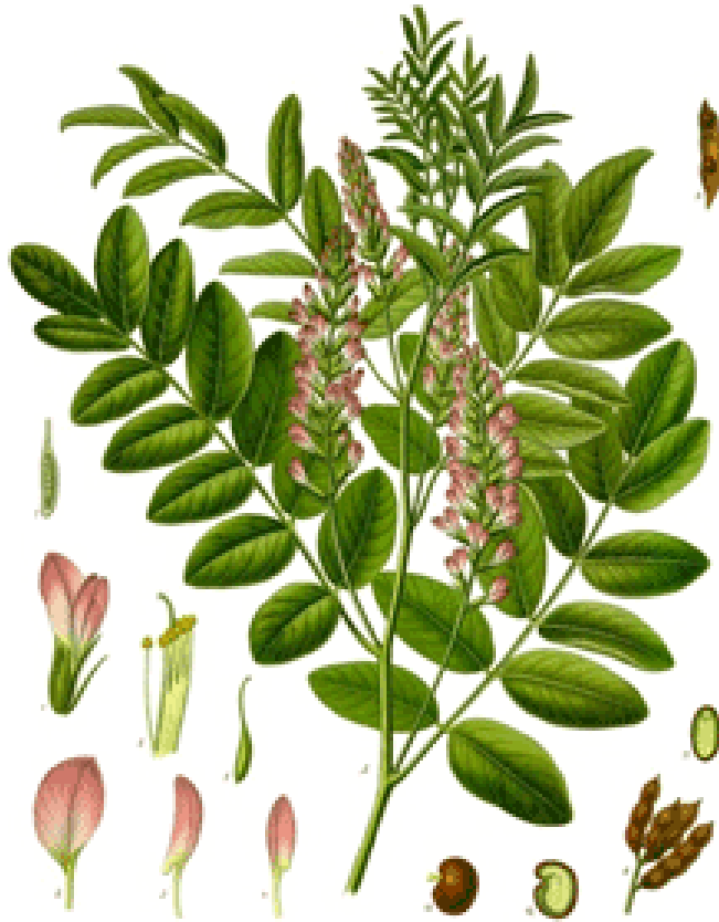
Alcaçuz (Glycyrrhiza glabra)